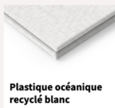
Plastique océanique recyclé blanc