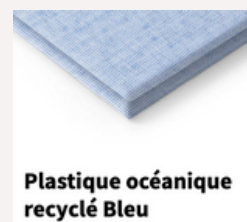
Plastique océanique recyclé Bleu