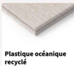
Plastique océanique recyclé