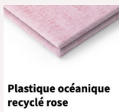
Plastique océanique recyclé rose